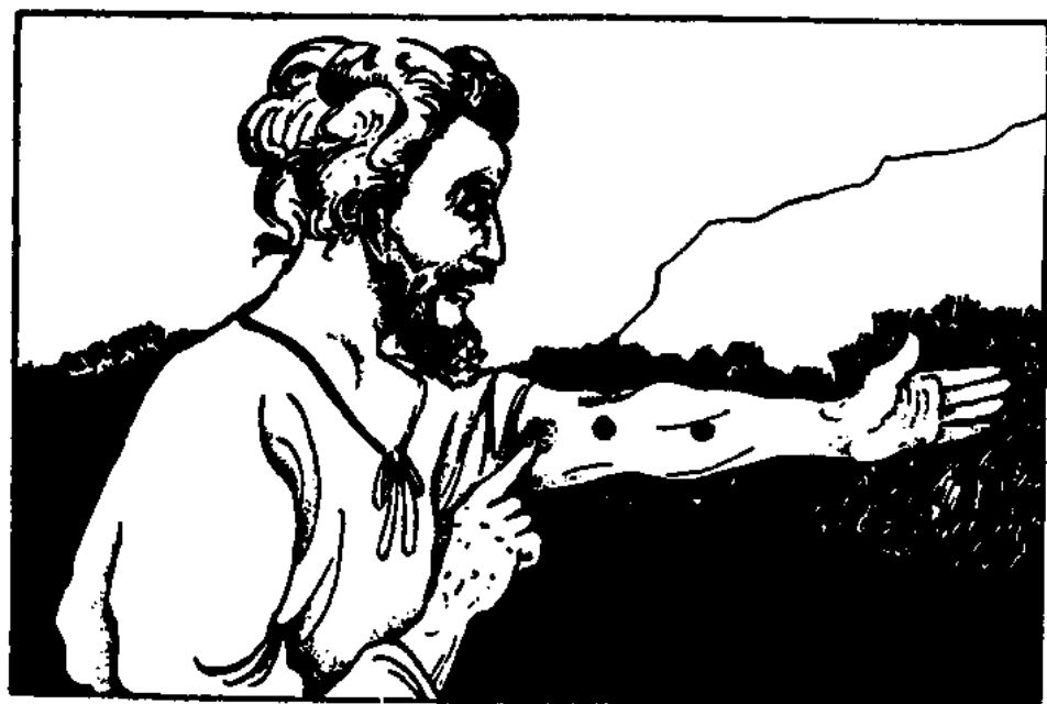
Otok, lišej, zářivá skvrna (3. Moj. 13, 2)

Malomocenství se může objevit téměř na všech částech těla. Malomocný nebyl nečistým pro to, co učinil, ale pro to, co byl; ne pro své skutky,