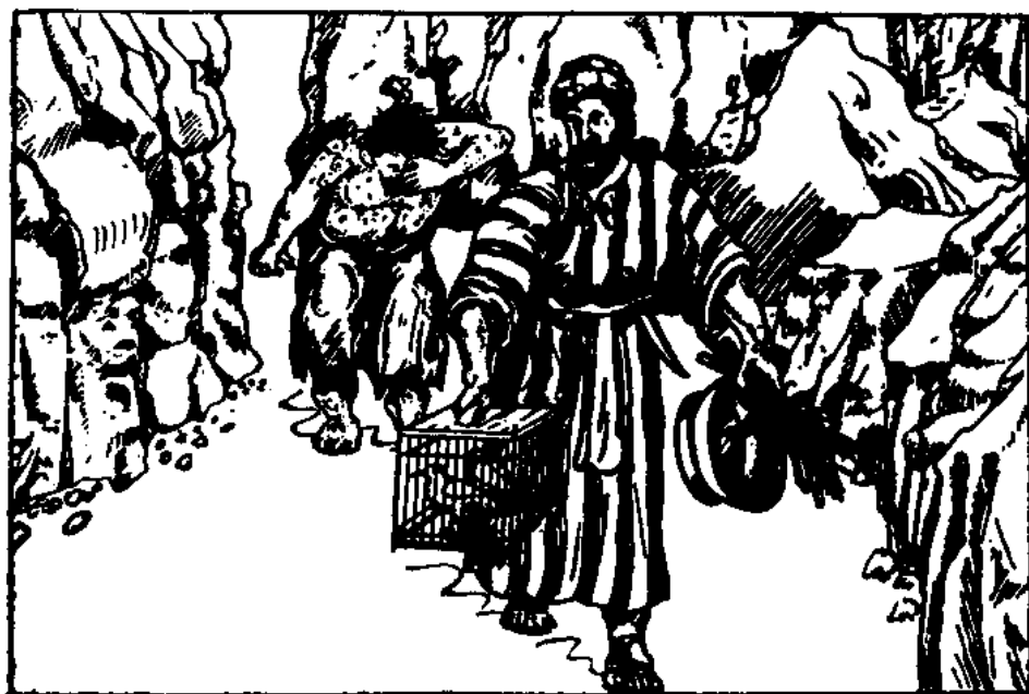
Ptáci, cedrové dřevo, šarlat a yzop (3. Moj. 14, 4)