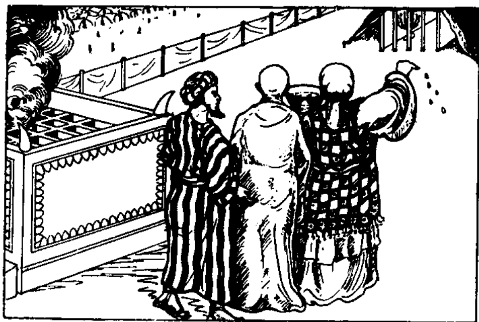
Kněz bude kropit olej sedmkrát před Hospodinem. (3. Moj. 14, 16)

“Z ostatku pak oleje toho, který má na ruce své, pomaže kněz kraje ucha pravého člověka toho, který se očišťuje, a palce pravé ruky jeho, a palce pravé nohy jeho, na krev oběti za vinu.“ (17. verš)