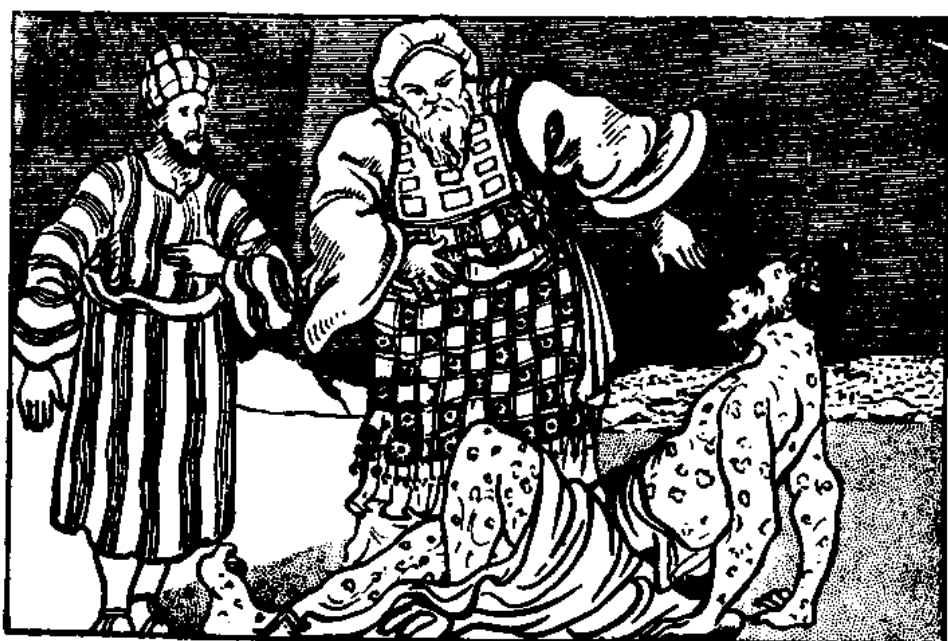
Celý se stal bílý. Je čistý. (3. Moj. 13, 13)

přel.) V zástupu vykoupených, kteří budou zalidňovat nebe, se nenajde ani jedna osoba, která by mohla zpívat: "Nikdy jsem nezhřešila a přišla jsem sem vlastním přičiněním." Píseň tam nahoře mluví o našem úplném ztroskotání, ale vyvyšuje obdivuhodnou Boží milost.