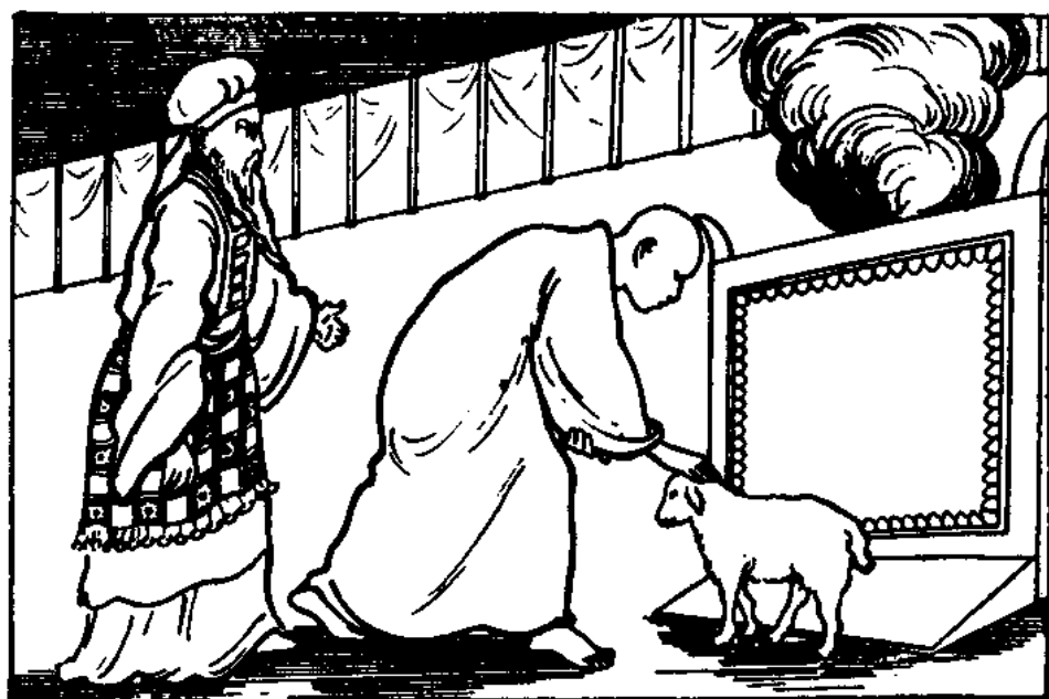
Beránek oběti za vinu (3. Moj. 14, 12)

Ztracený syn z Lukáše 15 se této lekci naučil, jak je zřejmé z jeho volání: “Zhřešil jsem proti nebi a před tebou.“