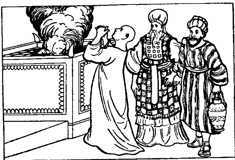
Před obětí zápalnou a obětí suchou (3. Moj. 14, 20)

Při oběti za vinu pokládá obětující svoji ruku na hlavu této oběti a všechna jeho přestoupení a jeho hříchy jsou přeneseny na oběť; on je jich úplně zbaven; už nemá vinu.