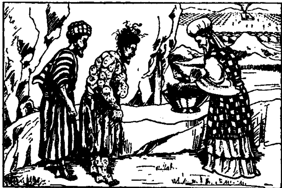
Živý pták, cedr, šarlat a yzop, omočené v krvi mrtvého ptáka (3. Moj. 14, 6)

Do krve mrtvého ptáka musel být ponořen nejen živý pták, ale zároveň s ním také cedrové dřevo, šarlat a yzop. Cedr mluví o velkých a vznešených věcech přírody, yzop je naopak symbolem nejnižších, opovrhovaných a hořkých věcí přírody. Šalomoun mluvil o “stromech od cedru Libánského až k yzopu, který roste ze zdi” (1. Královská 4,33). Muž, obdařený nejvyššími kvalitami inteligence a srdce, nejskvělejší žena, nejdo-