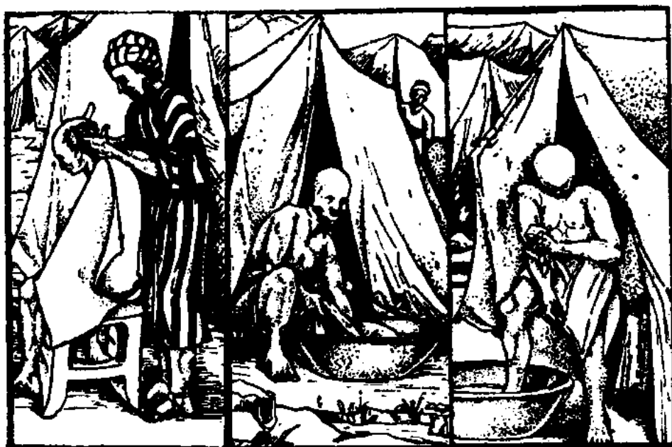
Opětné užití břitvy a vody (3. Moj. 14, 9)

Vlasy hlavy snad mluví o přirozené inteligenci, vous o zkušenosti, obočí o schopnosti pozorovat. Tak intelligence, zkušenost i kterákoliv jiná schopnost, vše má být přizpůsobeno Kristu a Jeho smrti.