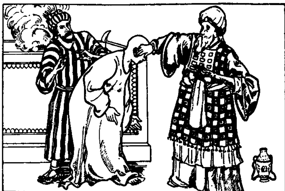
Dá olej na krev. (3. Moj. 14, 17)

Tušíme, že olej, daný na krev oběti za vinu, mluví o moci a energii Ducha Svatého v životě věřícího pro jeho chválení a službu ve slávě. Pán zaslíbil, že Utěšitel s námi bude provždy, a všechny ty různé činnosti v duchovním okruhu budou záviset na Jeho síle.