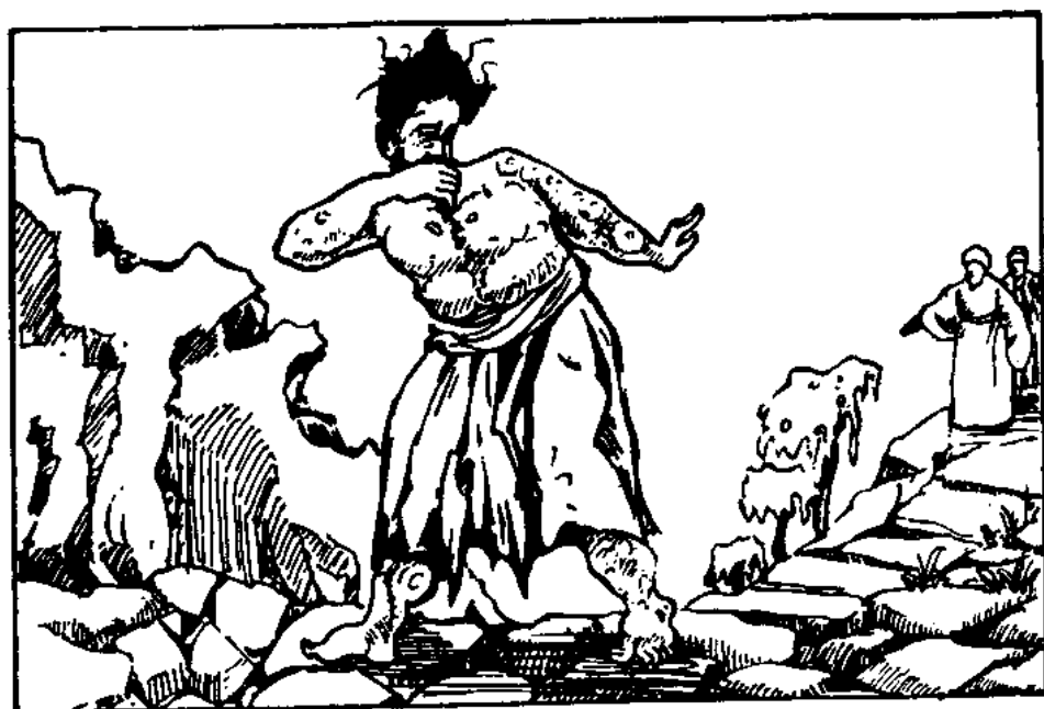
Roztržený oděv, odkrytá hlava, žalostné varování (3. Moj. 13, 45)

nezasažených. Má jen jedno volání, to žalostné a bolestné volání, které vysílá jako varování: “Nečistý! Nečistý jsem!” Jakým bláznovstvím je představovat si, že se nějaký hříšník může sám očistit, když je v takovém stavu, že i jeho dech je znečištěný a nakažlivý!